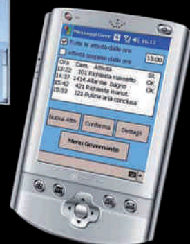
Gestione della governante