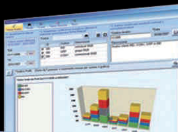
Mappa dei profili clienti