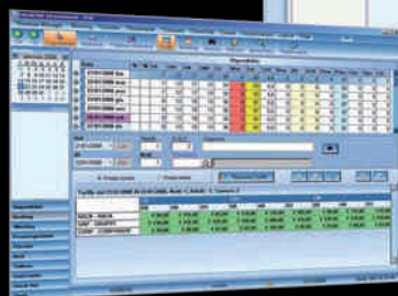
Disponibilità e tariffe in prenotazione